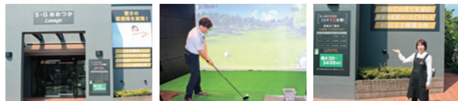
旧焼肉おおつかの店舗をリノベーション 世界の名門コースに挑戦 まずはご連絡ください

ご利用の際は入会金11,000円(税込み)の他、各プラン【ライトプラン月4回7,800円(税込み)~】の申込が必要です。ご興味のある方は是非焼肉おおつかへご連絡をお願いいたします。