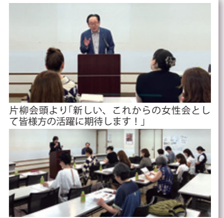
片柳会頭より「新しい、これからの女性会として皆様方の活躍に期待します!」

昨年11月20日の発足以来初めてとなる総会を開催しました。出席者20名のもと、令和6年度事業計画(案)並びに収支予算(案)が審議され、可決承認されました。また令和6年度は新たに10名の役員体制、更に女性会事業を活性化させるために「総務委員会」「研修委員会」「親睦委員会」の3委員会を女性会内に設け活動を進めて行く予定です。