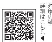
対象店舗 詳細はこちら

お問合せ: キャッシュレスキャンペーン実行委員会事務局(鹿沼市産業振興課内) TEL:0289-63-2182