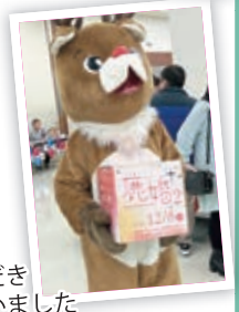
◀中間インテリジョン カードを集めるトナカイくん