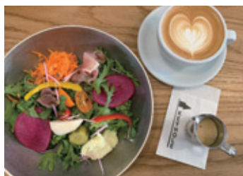
上質のカフェとサラダボウル

ちょっとしたテレワークはもちろん、貸切やバーチャルオフィスとしても利用できますので、ビジネスミーティングや学びの会、地域のセミナーなどに活用できそうです。