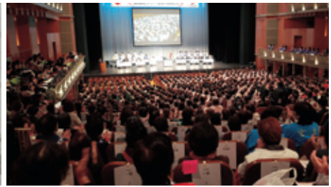
全国から2,500名が参加