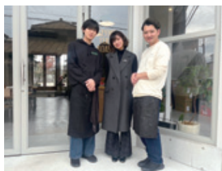
会話が弾むスタッフの皆さん