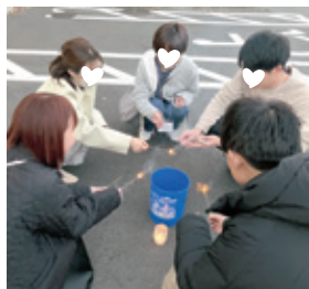
▲フィナーレの線香花火の様子