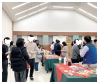
▲フリータイムで交流を深めています