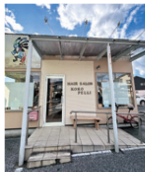
シンプルで可愛い外観

「おじゃまして〜す」掲載事業所を募集しております。 お問合せ：鹿沼商工会議所 総務課