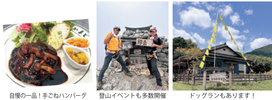
自慢の一品! 手ごねハンバーグ 登山イベントも多数開催 ドッグランもあります!

また、カフェ以外にも、初心者を対象にした登山イベントも各種開催しています。「絶景や花を愛でる」、「山頂でななかまど特製ランチと自家焙煎コーヒーを楽しむ」、「下山後に温泉やグルメを楽しむ」など内容盛りだくさんのイベントです。楽しい山歩きを通して山友が増える方も多いそうです。店内には登山に関する書籍も多数置いてありますので、登山好きな方も是非お立ち寄りください。