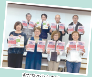
参加店のみなさま

約140人がまちゼミ講座に足を運び、店主の知恵やコツを学びました。参加者からは「親切なご指導で、とても楽しく参加することができた。次も参加したい。」「教えていただいたことを家でも実践してみたい」というような声が多く上がりました。